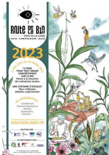
Table-ronde suivie d'un échange-dégustation avec les entreprises locales.

20h - CIC Ouest Nantes. Intervenants : Anthony Berthou (Enjeu mondiaux de l'alimentation), Gilles Daveau (Cuisine Alternative), Emmeline VERRIEST (« Au goût du jour », éducation par le goût, et anti gaspillage alimentaire).